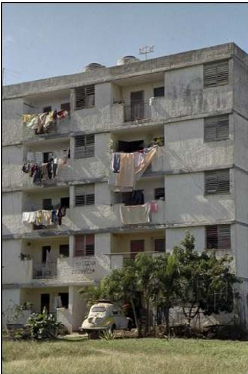
Foto 4 - Bloque de viviendas con elementos prefabricados e industrializados