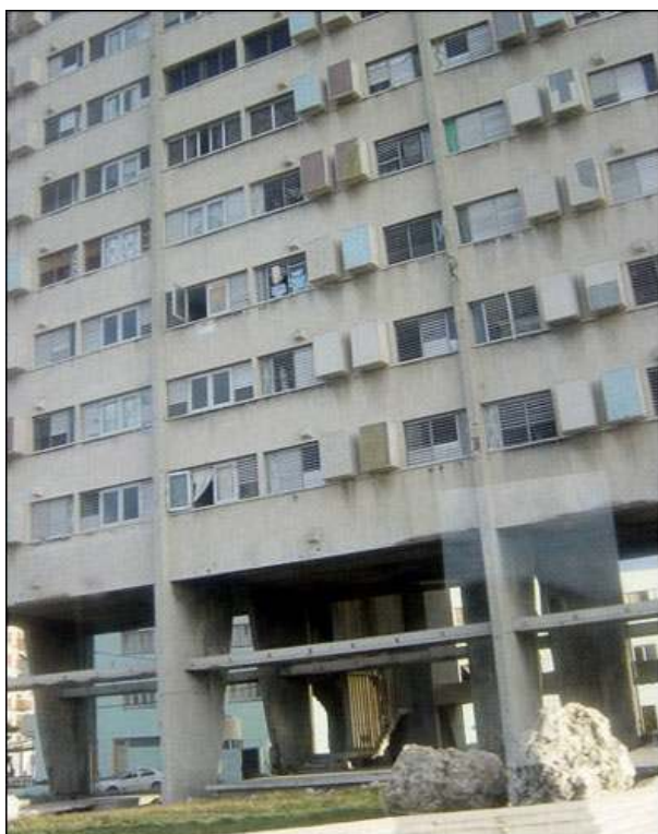
Foto 5 - Edificio en altura con elementos industrializados