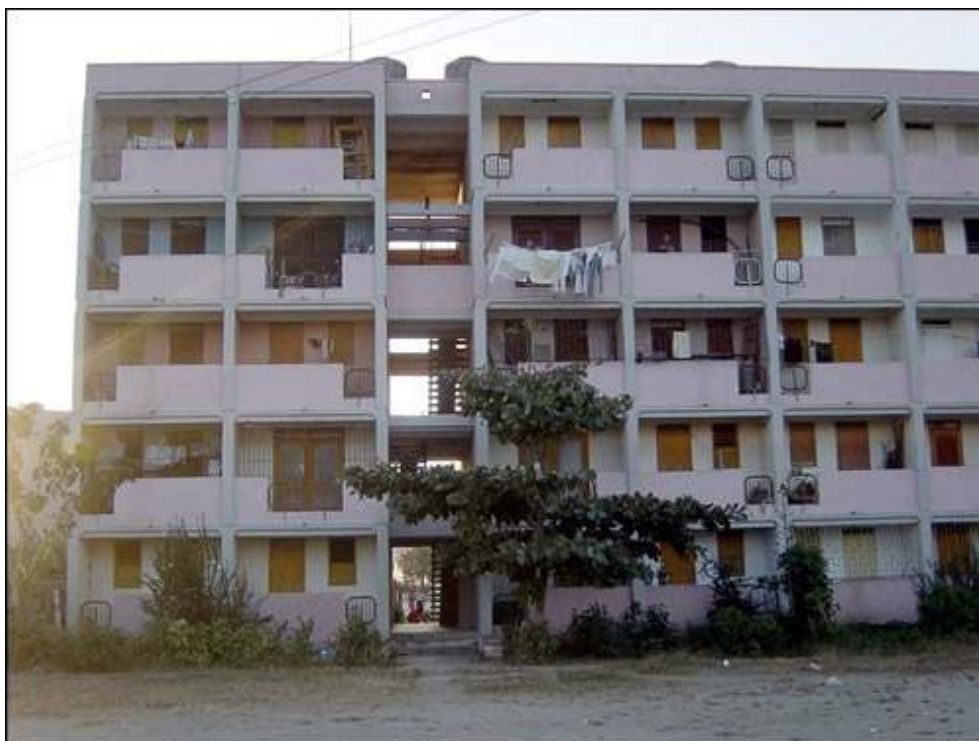
Foto 9 - Bloque de viviendas con sistemas abiertos