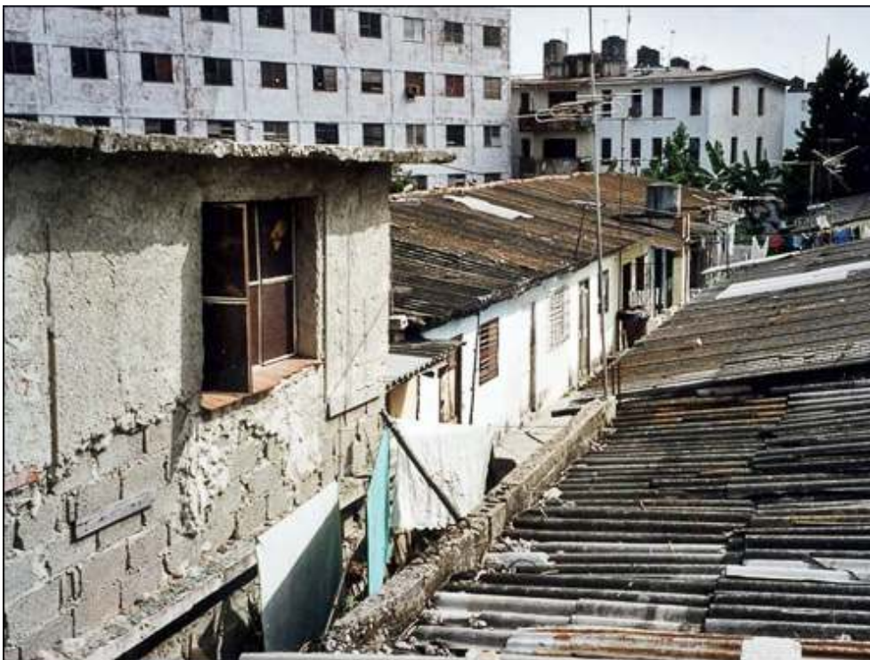
Foto 1 - Viviendas auto construidas