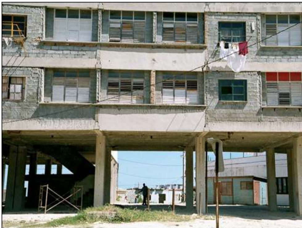
Foto 2 - Construcción artesanal con elementos prefabricados