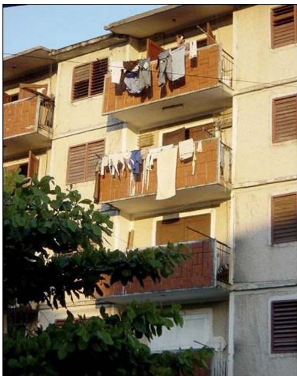
Foto 3 - Construcción artesanal con elementos prefabricados