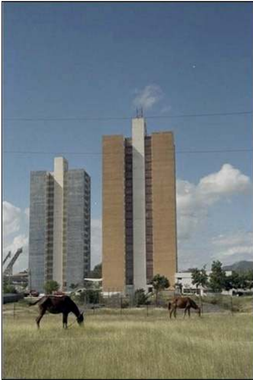
Foto 7 - Edificios en altura con elementos industrializados