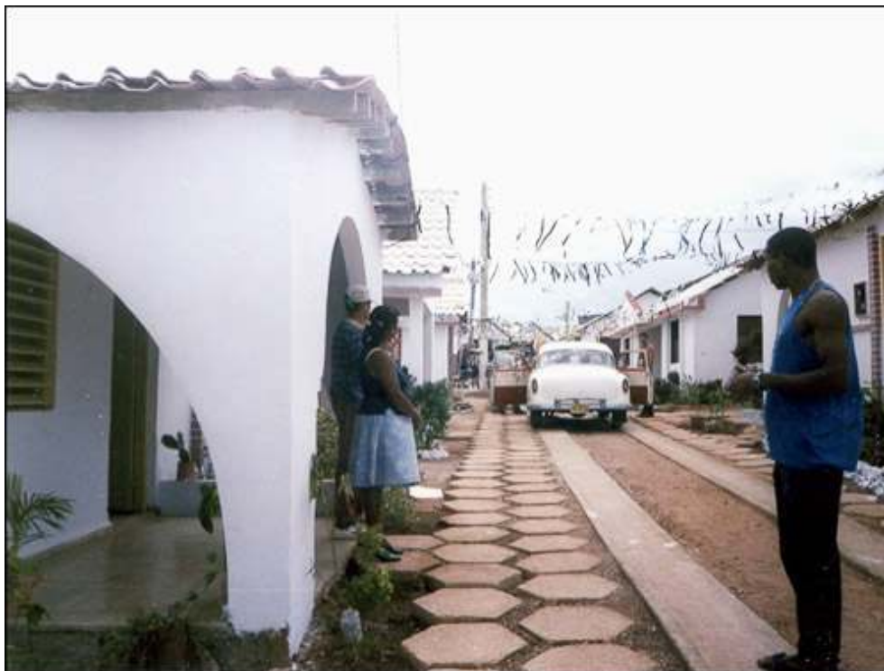
Foto 13 - Conjunto habitacional de viviendas nuevas construido bajo la dirección de Hábitat-Cuba