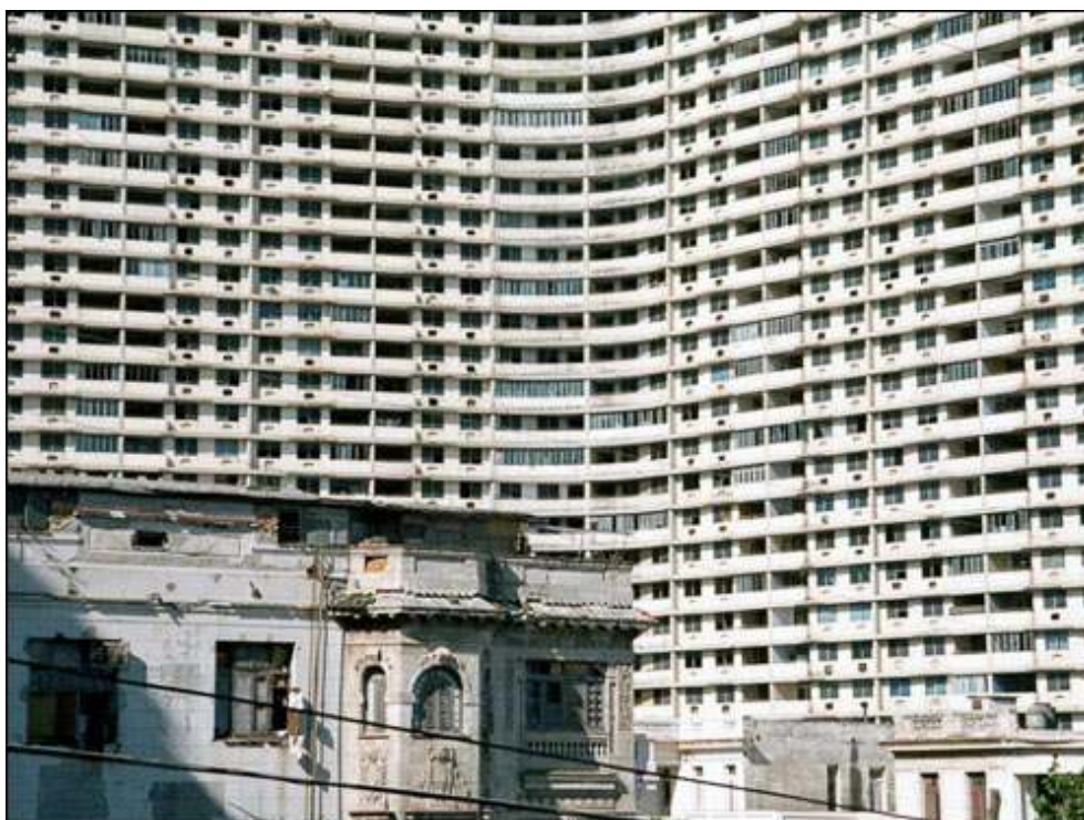
Foto 6 - Edificio en altura con elementos industrializados