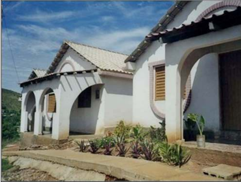
Foto 12 - Conjunto habitacional de viviendas nuevas construido bajo la dirección de Hábitat-Cuba

ciudad de Holguín -un conjunto de viviendas nuevas y un proyecto de rehabilitación en el centro de la ciudad, (fotos 12 a 15)- puso en evidencia que las innovaciones introducidas por los equipos de Hábitat-Cuba permitieron obtener viviendas de calidad constructiva comparable a las producidas por el Estado, de mejor calidad espacial y diversidad funcional, a costos inferiores. Respecto de la autoconstrucción, se produjeron viviendas de mucha mejor calidad arquitectónica y constructiva con poco incremento en los costos.