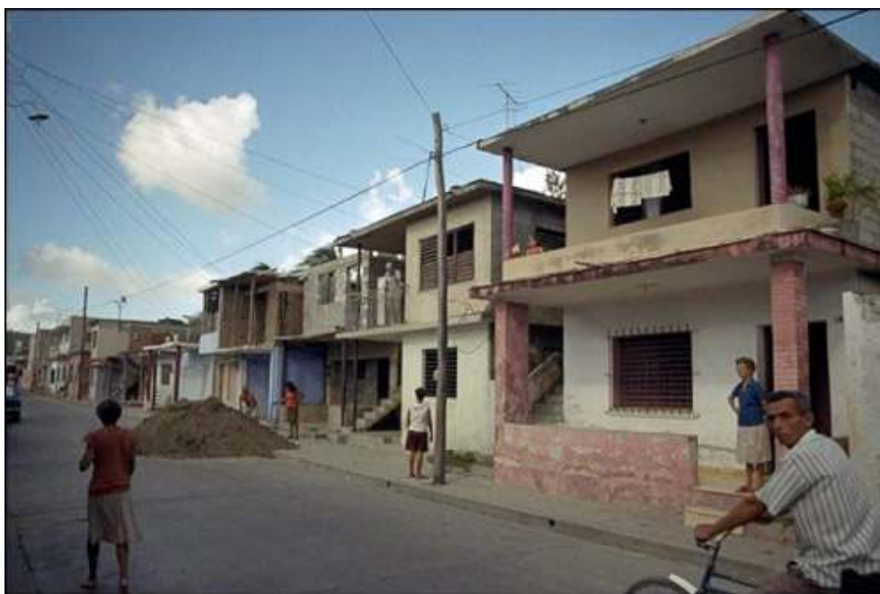
Foto 15 - Proyecto de rehabilitación bajo la dirección de Hábitat-Cuba