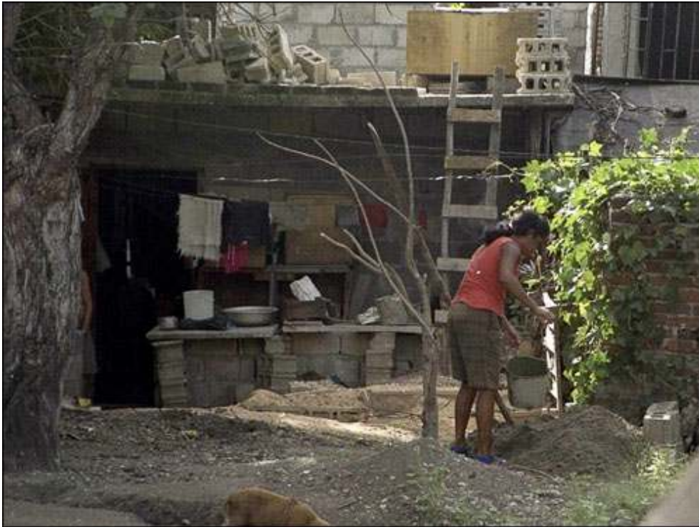
Foto 11 - Viviendas auto construidas