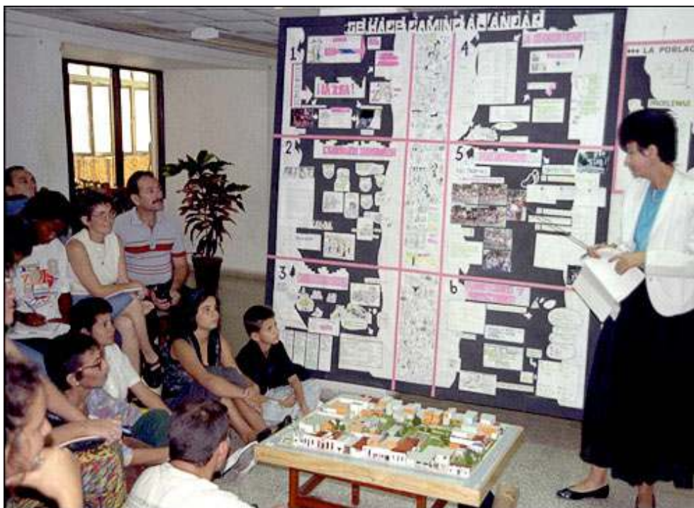
Foto 14 - Concepcion participativa de proyecto de rehabilitación por Hábitat-Cuba