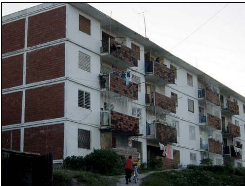
Foto 8 - Bloque de viviendas con sistemas abiertos