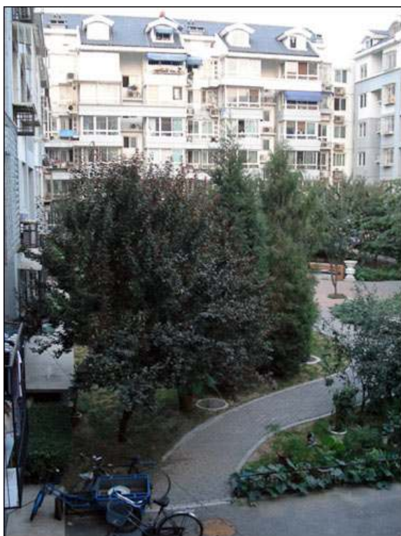
Photographie 2 - Espace collectif à l'intérieur d'une résidence