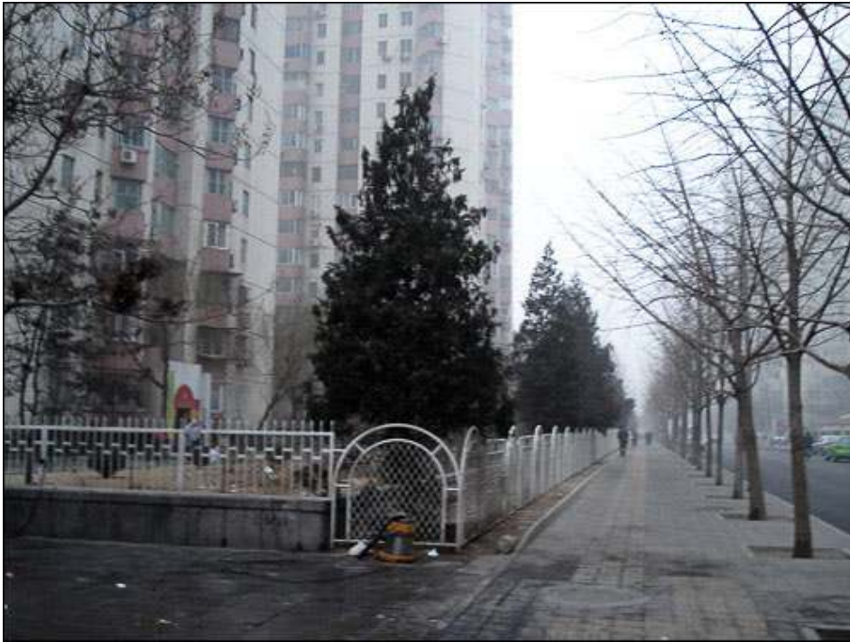
Photographie 1 - Cloisonnement de l'espace résidentiel et de la rue