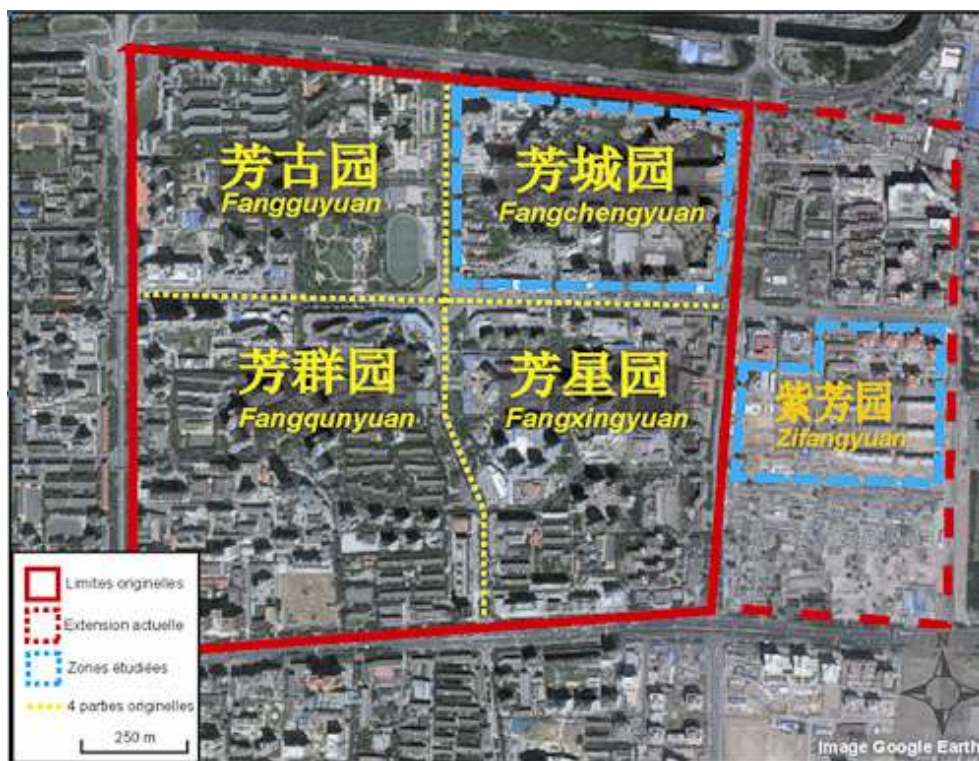
Carte 1 - Carte des zones étudiées