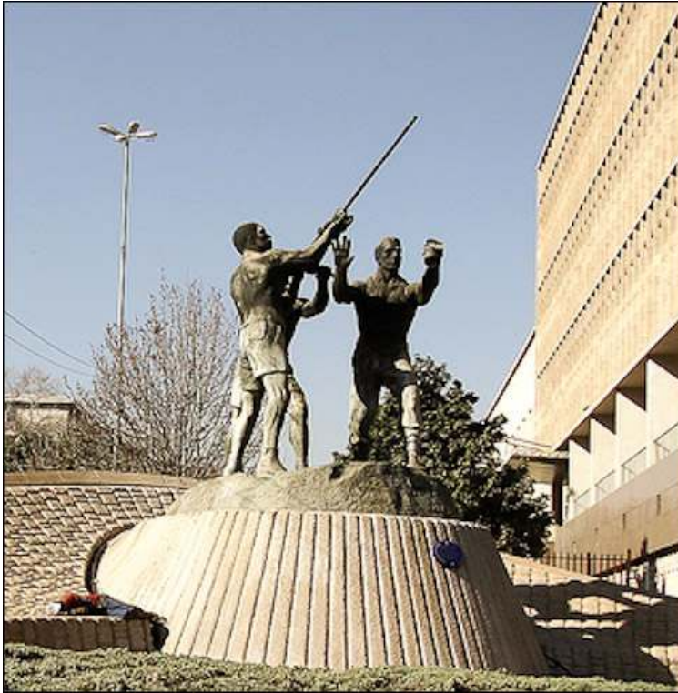
Illustration 1 - Le « monument des mineurs », exemple-type de l'art public de l'apartheid