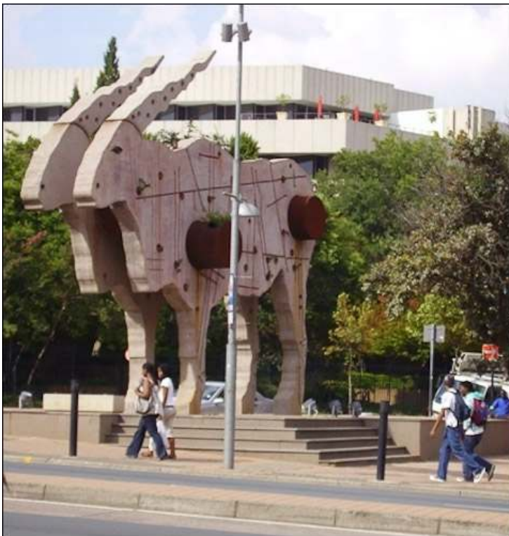
Illustration 2 - L'Eland de Clive van der Berg, une icône ?