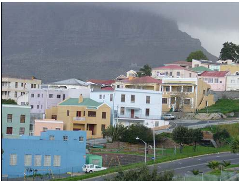
Illustration 1- Bo Kaap, dernier quartier de working class dans le centre-ville du Cap ?

Bo Kaap, septembre 2008.