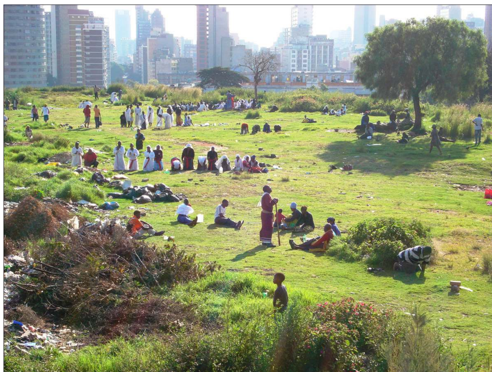
Illustration 1 – The Ridge, Johannesburg, 2010