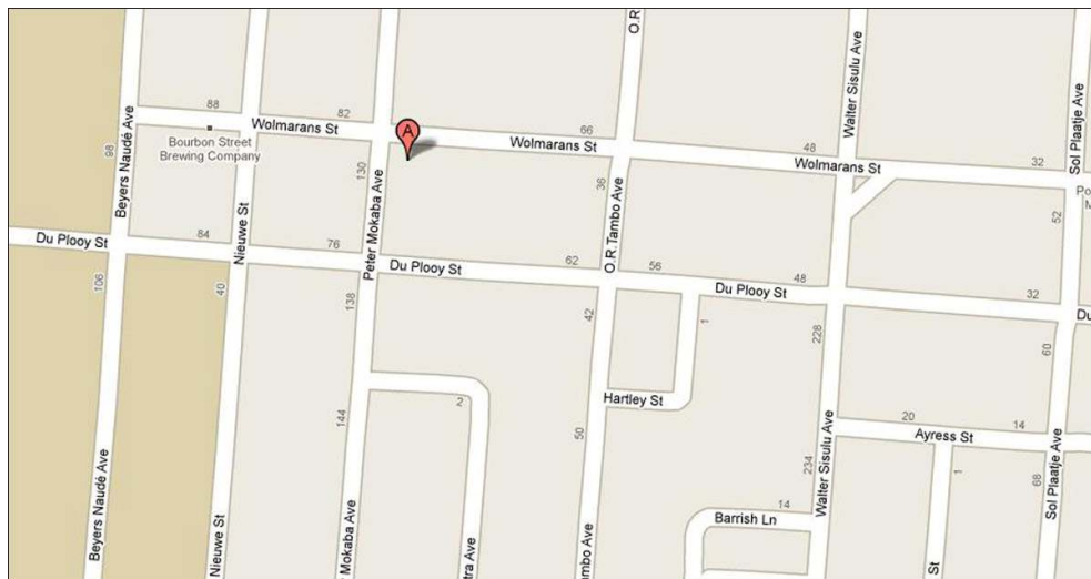
Illustration 3 - Extrait du plan Google Map de Potchefstroom

Auteur : Béatrice Obry-Guyot, début décembre 2007.