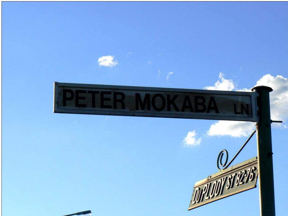
Illustration 2- Potchefstroom (Afrique du Sud)

Auteur : Béatrice Obry-Guyot, début décembre 2007.