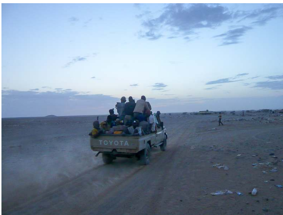
Illustration 4 - Orpailleurs de Tchibarakaten partant clandestinement au crépuscule vers les sites aurifères algériens