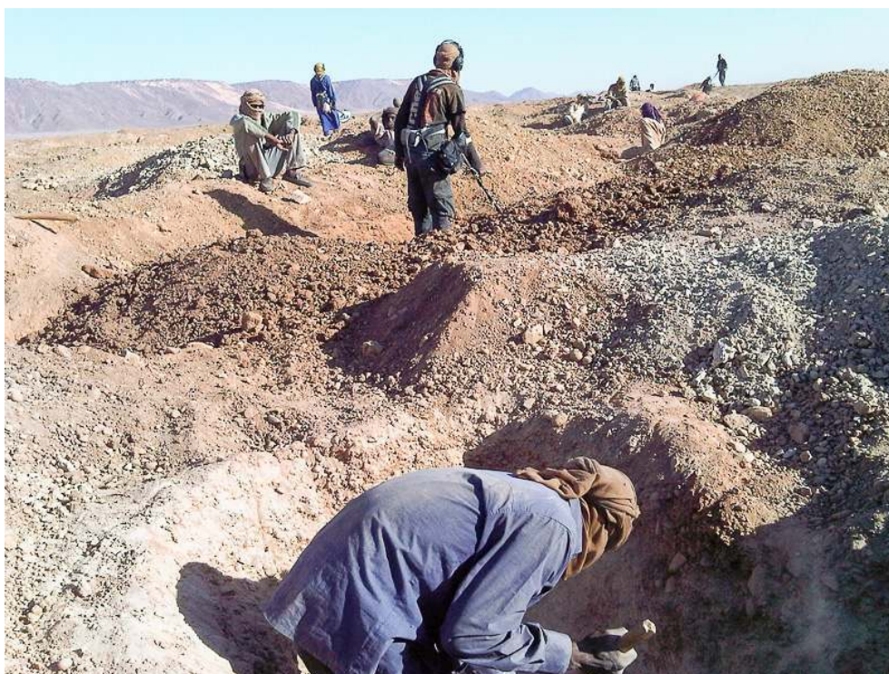
Illustration 2- Site aurifère du Djado