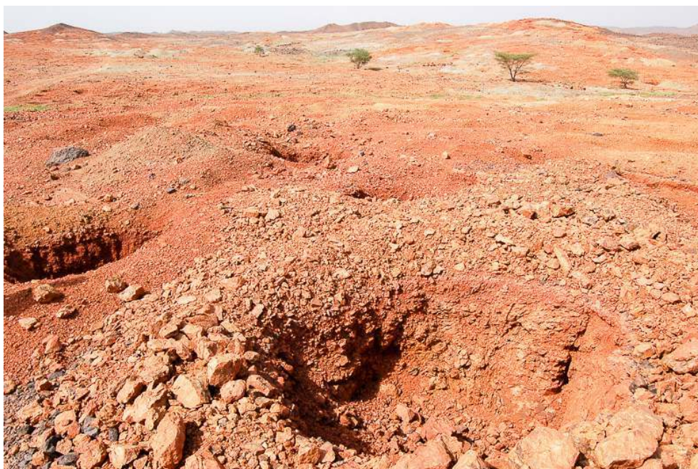
Illustration 5 - Site aurifère de Gofat situé près d'Agadez au sol entièrement décapé après son déguerpissement par les autorités

cartographiée, il était surtout connu pour ses réserves de cassitérite (étain exploité depuis 1948) et d'uranium sur sa bordure occidentale. Il renfermerait aussi des pierres précieuses (émeraude, platine, rubis, saphir, etc.) et divers métaux (colombo-tantalite tungstène, cuprite, etc.). L'or s'y présente sous la forme de paillettes et de pépites contenues dans les sables des vallées alluvionnaires. Le traitement de la roche se fait artisanalement sur place ou à Tabelot et Agadez par des procédés mécaniques et chimiques.