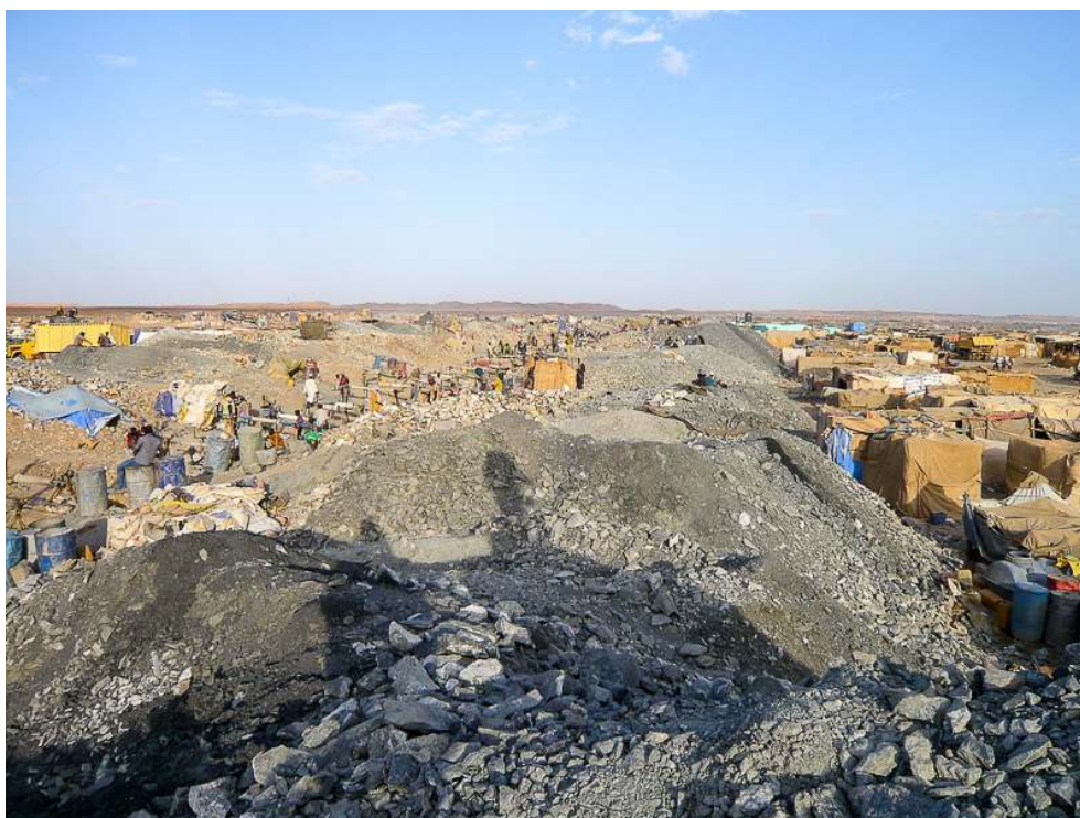
Illustration 3 - Site aurifère de Tchibarakaten

Au centre, le filon avec les puits d'accès et les poulies, les stériles de part et d'autre, à droite, le marché principal.