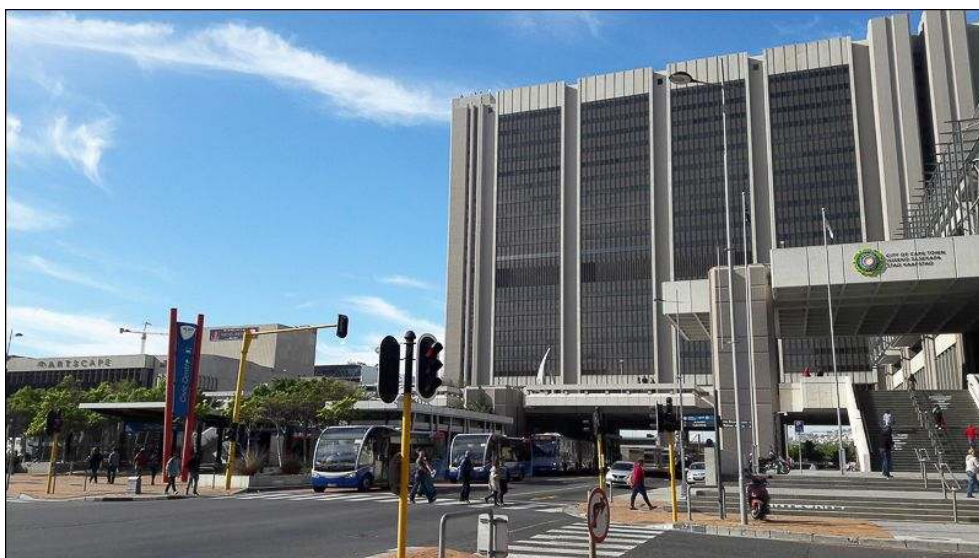
Illustration 7 - Le principal hub (arrêt Civic Centre ) du réseau MyCiti , au pied de la municipalité du Cap