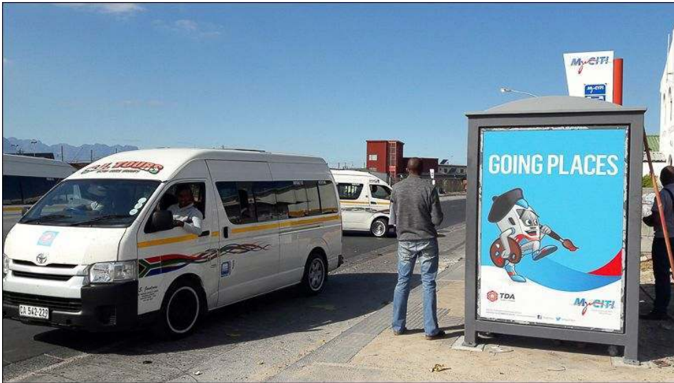
Illustration 4 - À Khayelitsha, les minibus attendent les passagers sur les espaces dédiés aux bus MyCiti