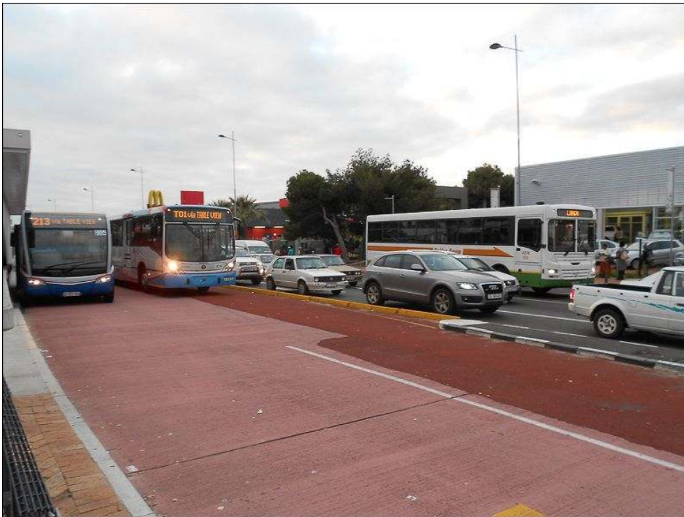
Illustration 1 - Des services de bus à deux vitesses

MyCiti sur sa voie dédiée, le bus d'ancienne génération Golden Arrow à destination de Langa dans la circulation (arrêt de Bayside à Table View).