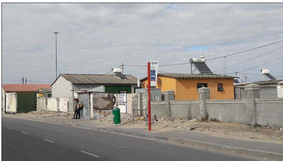
Illustration 6 - Un arrêt de bus MyCiti à Khayelitsha

Il s'agit du plus grand township africain au sud-est du Cap. Plus de cinquante kilomètres séparent ces deux arrêts.