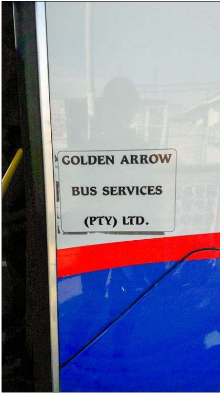
Illustration 2 - Bus MyCiti, un exemple de compagnie, fusion de différents opérateurs

Sur la carrosserie du bus MyCiti , la mention de la compagnie Golden Arrow , fusion de la compagnie de bus d'ancienne génération du même nom et des associations de minibus opérant entre le CBD et les townships de Mitchell's Plain et Khayelitsha.