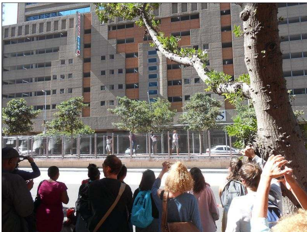
Illustration 8 - La mise en scène des pratiques de mobilités quotidiennes à travers une performance au sein des infrastructures MyCiti pendant le festival Infecting the City