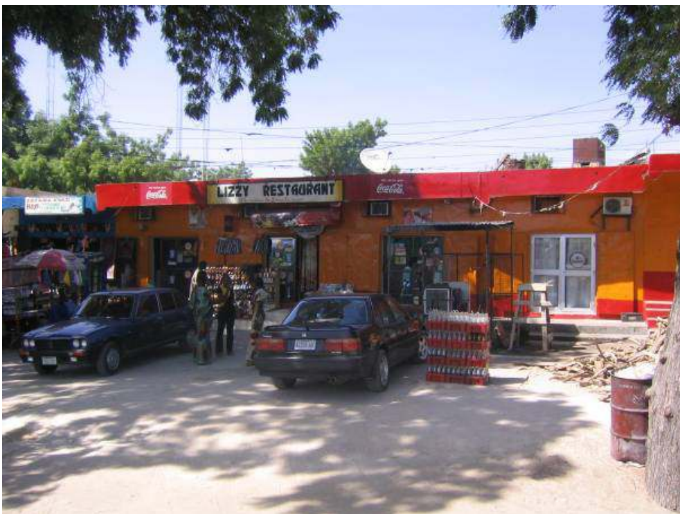
Exemple 3 - Groupe électrogène d'un petit restaurant. Une privatisation coûteuse