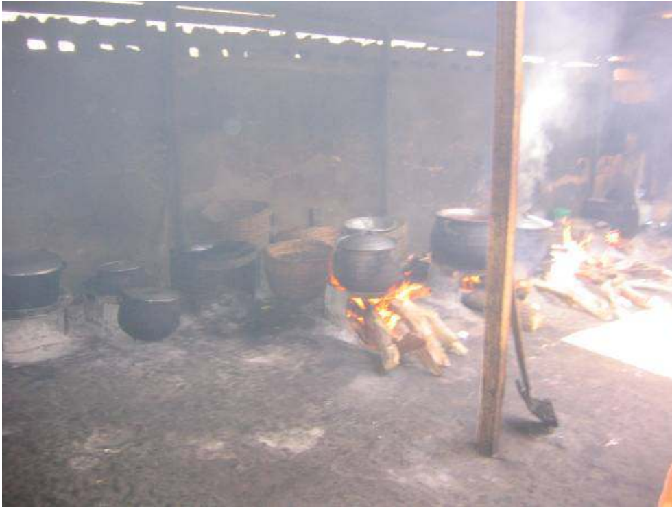
Exemple 1 - (Maiduguri, Borno State, NE Nigeria, décembre 2003)