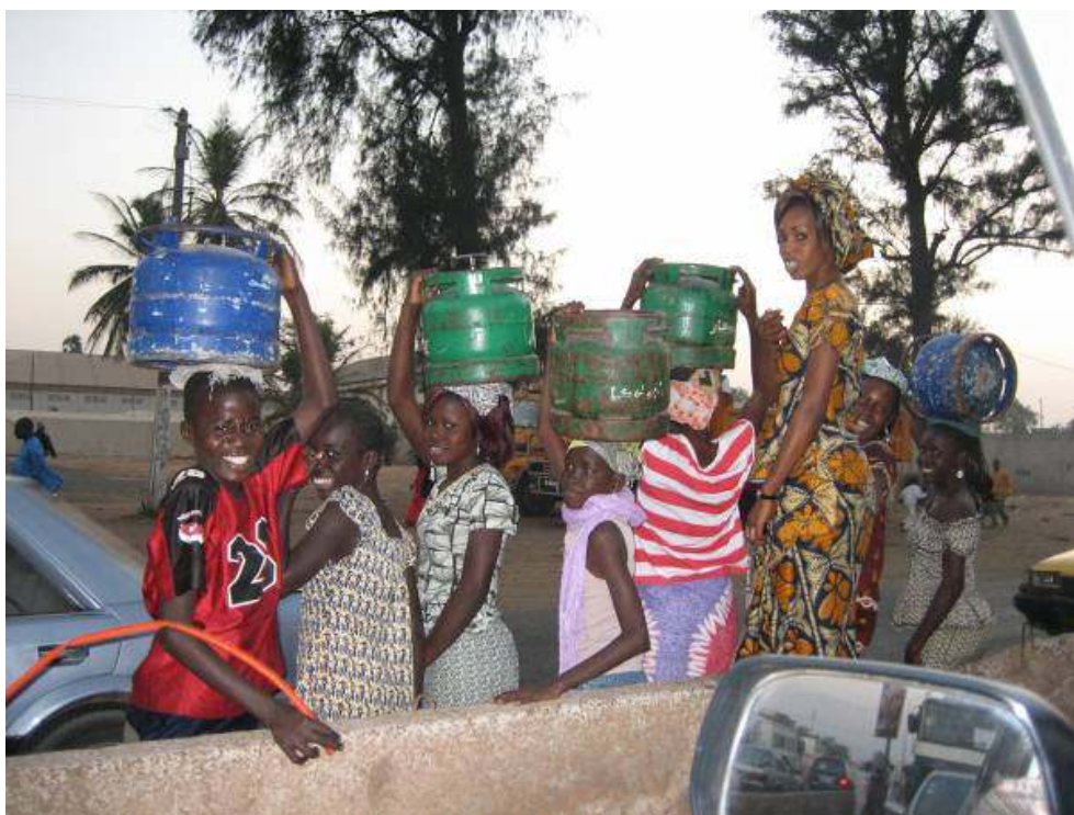
Photo 4 : pénurie de gaz à Thiaroye, banlieue de Dakar (janvier 2007).

Dans le pays le plus urbanisé du Sahel et le plus largement ouvert aux importations, la substitution du gaz au bois énergie a été un succès. Mais il demeure fragile : spéculation et hausse des prix des hydrocarbures pourraient hypothéquer l'avenir ; Cliché : G. Magrin