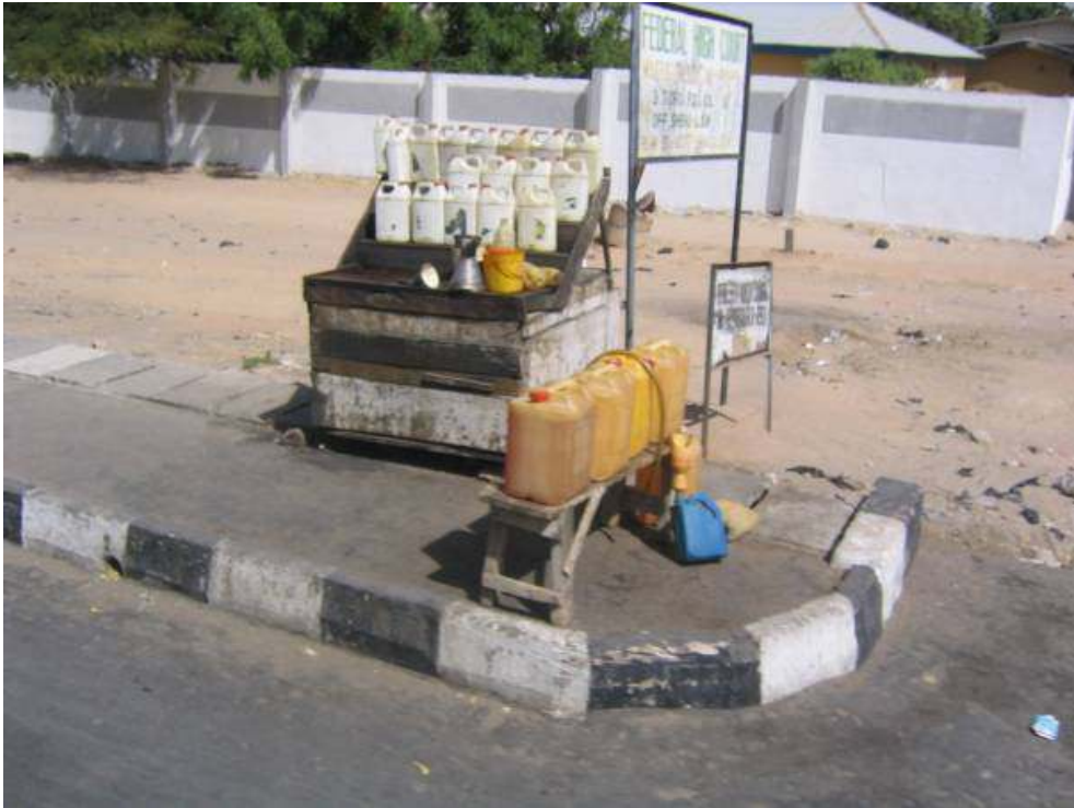
Exemple – 2 Vente informelle d'essence... les vols représentent 10 % de la production pétrolière nationale