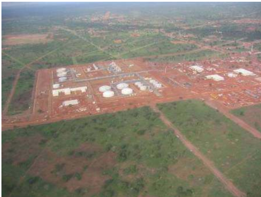
Photo 1 : Traitement du pétrole et torchage du gaz à Komé (Tchad, juin 2004)

Dans tout le Tchad méridional (3,5 millions d'habitants), seules trois villes sont électrifiées.