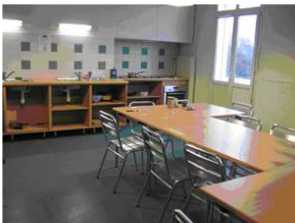
Photo 1 - Une cuisine-salle à manger à la Maison du Canada, deux pièces rénovées et accueillantes