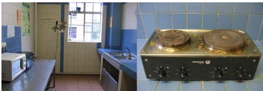
Photos 2a et 2b - Une cuisine à la Fondation Deutsch de la Meurthe, un espace exigu et un simple lieu de passage