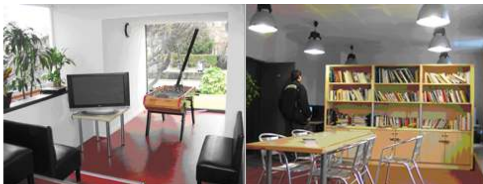
Photos 3a et 3b - Un salon et un espace médiathèque à la Maison du Canada